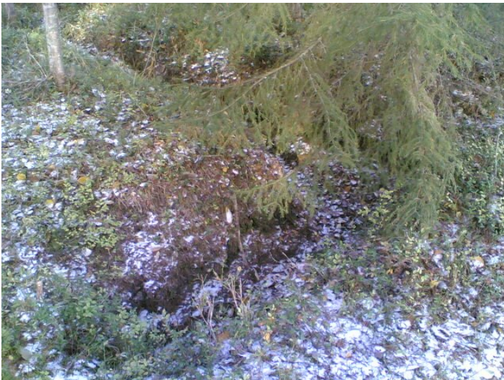
Kuva A 1