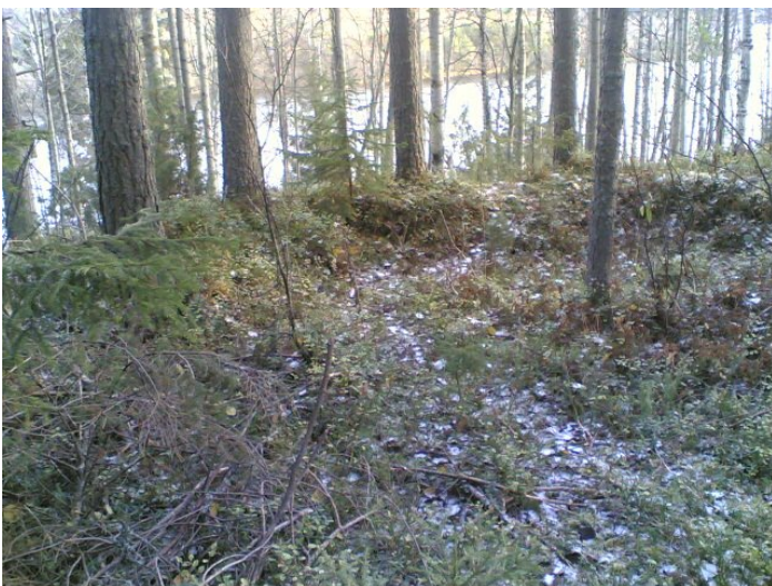
Kuva C 1.