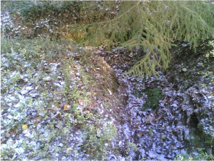
Kuva A 2.