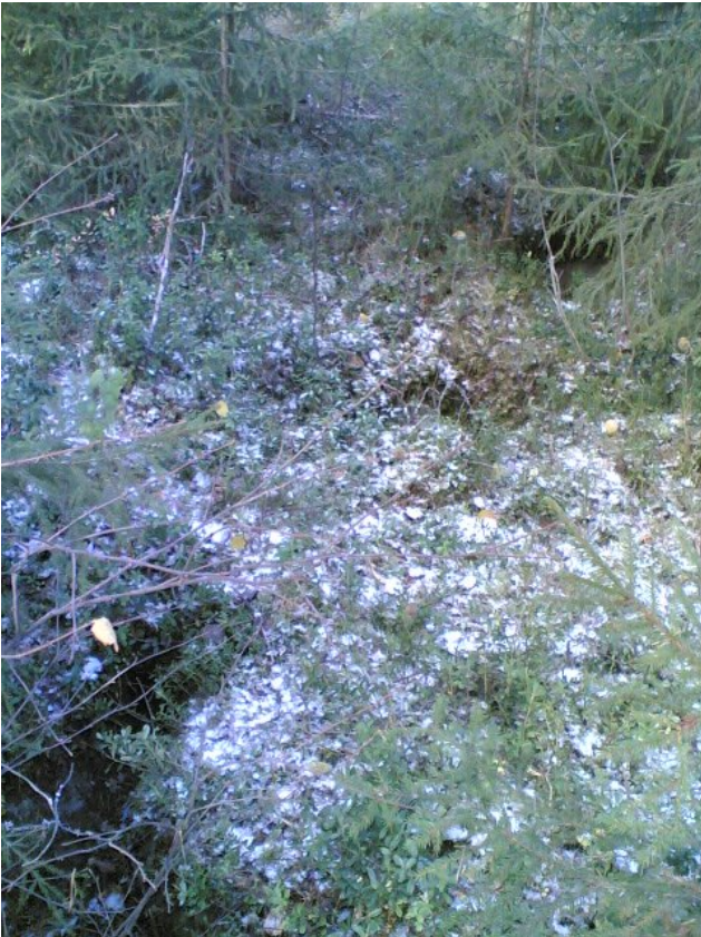
Kuva D 2.