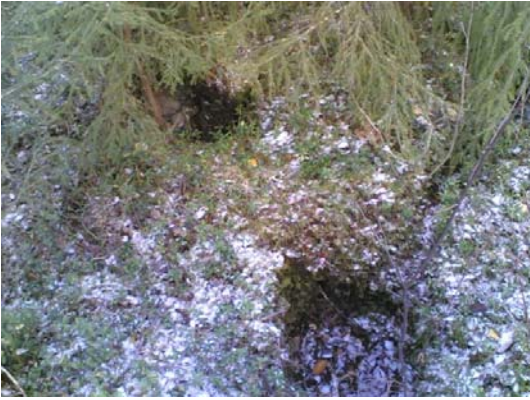
Kuva D 1.