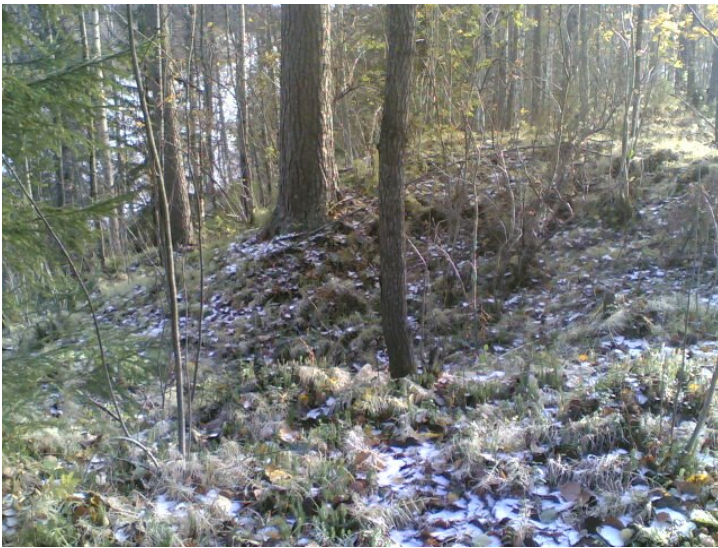
Kuva B 1.