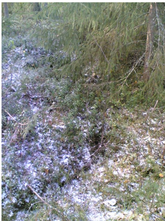
Kuva E-F 2.